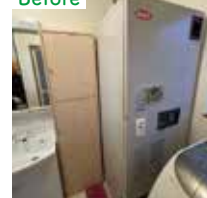
給湯暖房一体型電気温水器